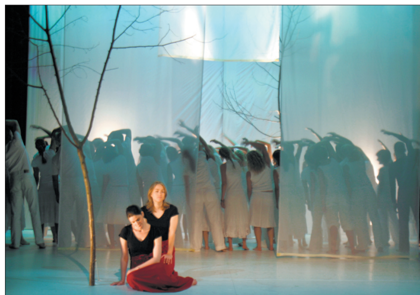
Szene aus dem Musiktheater «Sweet passion and pain», das der Jugendchor Sursee im Jahre 2006 aufführte.